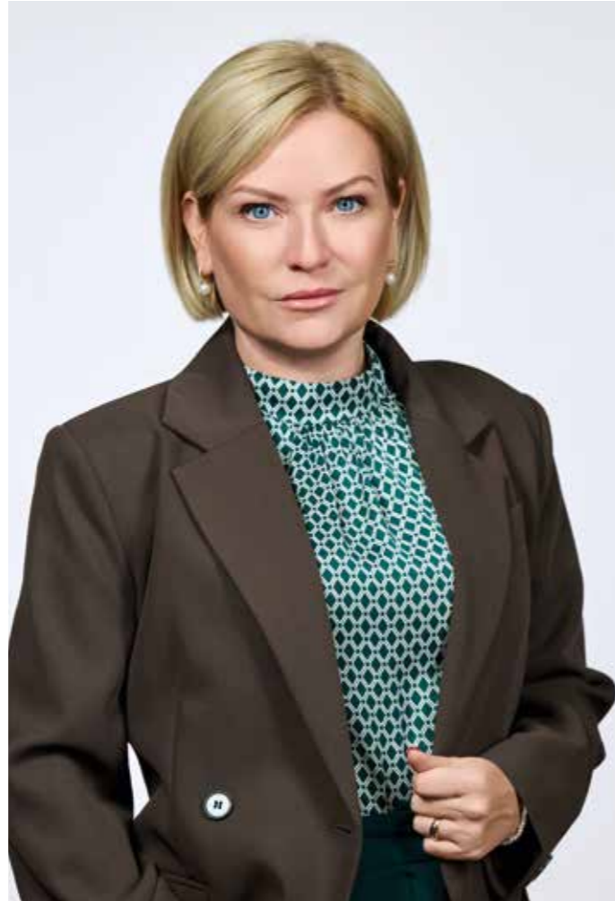
Министр культуры Российской Федерации Ольга Любимова

Желаю всем ярких эмоций, вдохновения и незабываемых впечатлений от концертов!