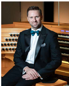
ЛУКА ГАДЕЛИЯ — органист, Заслуженный артист Республики Абхазия, солист Сухумской филармонии.