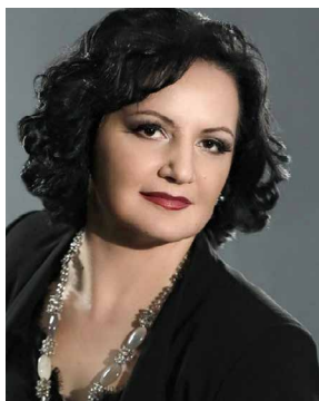
АЛИСА ГИЦБА — Заслуженная артистка России, Народная артистка Республики Абхазия, солистка Московского музыкального театра «Геликон-опера».