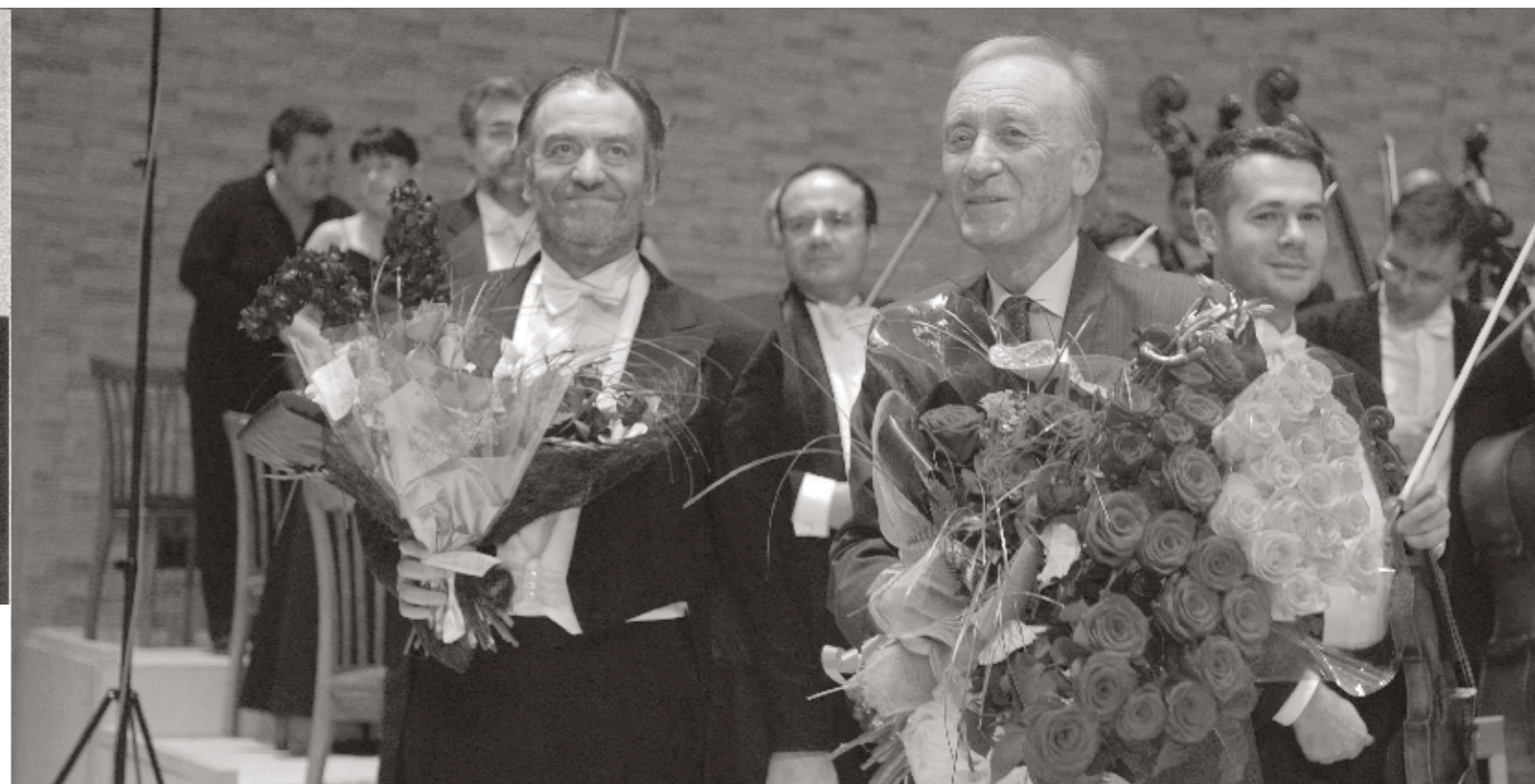
С В.А. Гергиевым

Особая и значительная страница в жизни Щедрина связана с Мариинским театром и его художественным руководителем В.А. Гергиевым. Сегодня Мариинский театр и его оркестр исполнили, кажется, все крупные оркестровые, кантатно-ораториальные и концертные сочинения композитора. Его оперы и балеты получили новую жизнь на замечательной сцене. Ежегодно театр проводит абонемент театральных произведений композитора. Но самое главное: Мариинский инициирует рождение новой музыки Щедрина. Две последние оперы — «Левша» и «Рождественская сказка» — обязаны своим появлением В.А. Гергиеву. По его инициативе камерный зал театра получил имя Щедрина.